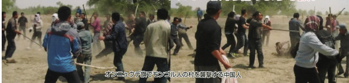
オンニューデ旗でモンゴル人の村を襲撃する中国人