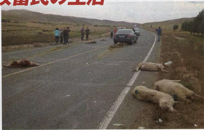
▲勝手に敷いた道路を走る中国人ドライバーは、牧畜民の財産である家畜をどんどん轢き殺してしまう。土地だけでなく、財産、人権、すべてを奪っていくのが中国のやり方である。

トがある。だから世界で何が起きていくのか、真実を知りやすい時代になった。中国の横暴は、日本でも知られつつある。しかしそれは他民族を弾圧している中国の全貌ではない。ほんの一部なのだ。大半は政府によって徹底的に隠されている。そして政府はこう発表するのである。