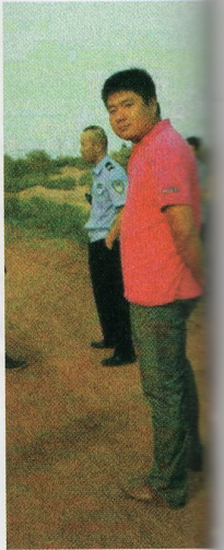
▲モンゴル人を撲殺した殺人犯の姿。動揺した表情すら浮かべていない。 ◀土地を占有しようとする中国人のモンゴル人に対する暴行事件は絶えない。