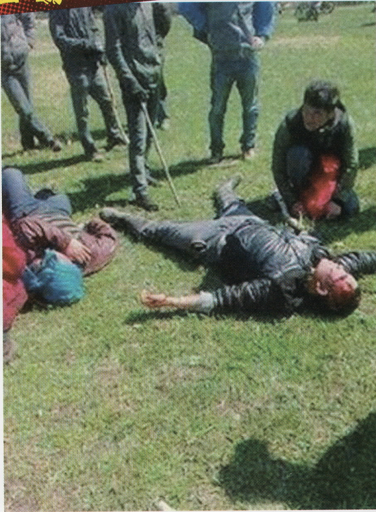
▲2013年5月17日、100人以上の中国人がモンゴル人牧畜民を襲撃。10人以上の負傷者が出た。