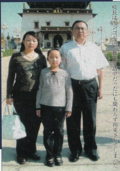
校長はモンゴル国で難民申請中だったにも関わらず拘束されてしまった。

南モンゴルの学校では中国語教育を強制されている。しかし写真の医学学校の校長先生は、モンゴル語での教育に熱心に取り組んでいたため、中国警察によって家族共々逮捕されてしまった。校長先生は懲役3年の刑に処されたという。