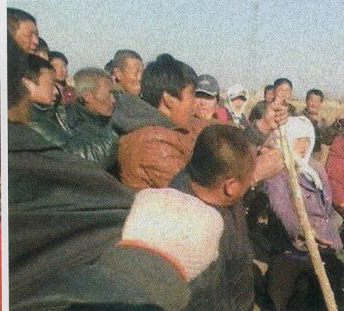
◀オルドス市で、草原の土地を不法に占有されたことに抗議をした牧畜民は、殺害されました。