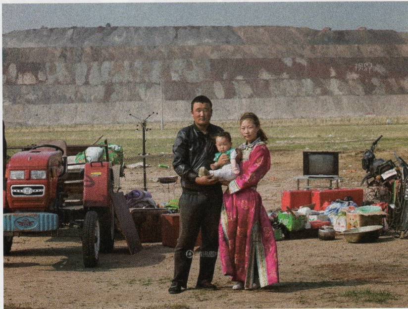
▲中国は開発のため、牧畜民を次から次へと牧草地から追い出し、都市部に移住させる政策を採っている。今後もっと増加させるという。