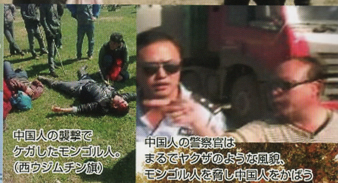
中国人の襲撃でケガしたモンゴル人。(西ウジムチン旗)