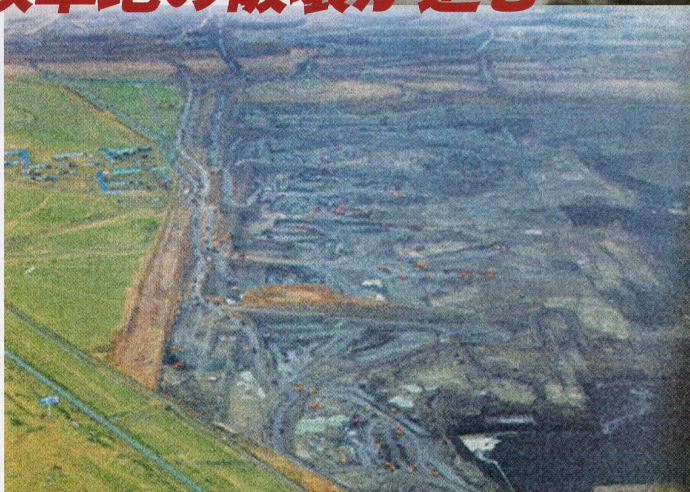
▲強引な手法で牧畜民を追い出し、勝手に道を敷き、石炭を掘り起こす…… このようにして壊されていく草原の姿。緑豊かだった南モンゴルの牧草は減少している。