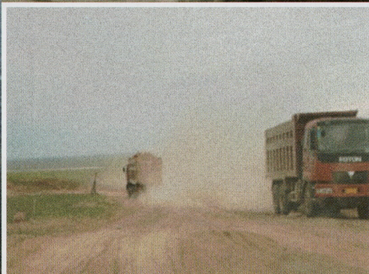
▲石炭を運ぶトラック。中には道路を走らず、草原を突っ切っていくこともあり、徐々に草原が駄目になってしまうのだ。

まるで無法地帯のようだが、実際はそうではなく、モンゴル人にとってのみ一方的に厳しい状況だ。相手の横暴に対してやり返そうものなら、警察はすぐに取り押さえ、「反国家分子」「分裂主義者」という名目の下、逮捕するという。つまり中国人の横暴は許されるが、モンゴル人の反撃は一切許されない状態なのだ。