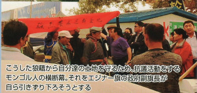
こうした狼藉から自分達の土地を守るため、抗議活動をするモンゴル人の横断幕。それをエジナー旗の政府副旗長が自ら引きずり下ろそうとする