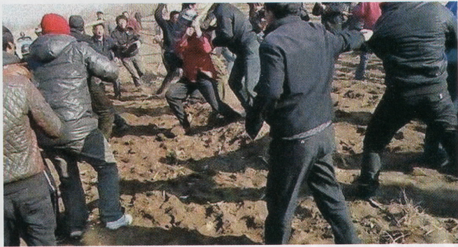
▲2013年4月27日、中国人がモンゴル人に暴行を加える。怪我をさせても、加害者である中国人が罰せられることはない。だからこのような事件が何度も繰り返される。